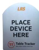
RF-ID adesiva da tavolo

dimensione: 12,7 x 10,16 x 1 cm peso: 0,03 kg codice: TT-PCU-CASE