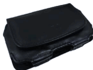
custodia da cintura in pelle

dimensione: 12,7 x 10,16 x 1 cm peso: 0,05 kg codice: TT-PCU