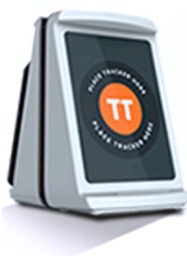
Dock per Table Tracker

dimensione: 12,7 x 10,5 cm codice: TT-TOPLABEL